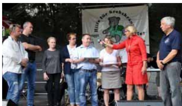
Ein bewegender Augenblick auf der Bühne: Spender aus der Gemeinde Kall und Empfänger von Stammzellen aus Brandenburg und dem Schwarzwald trafen sich beim Familienfest in Urft.

Von Reiner Züll (mit Bildergalerie) Hilfsgruppe feierte ihren 25. Geburtstag – Familienfest mit zahlreichen Überraschungen – Bereits vor 25 Jahren für Tschernobyl-Kinder eingesetzt – Über 100 Helfer bereiteten Festtag vor