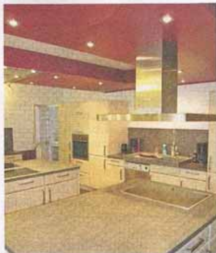
Die moderne Selbstversorgerküche ergänzt das Angebot.